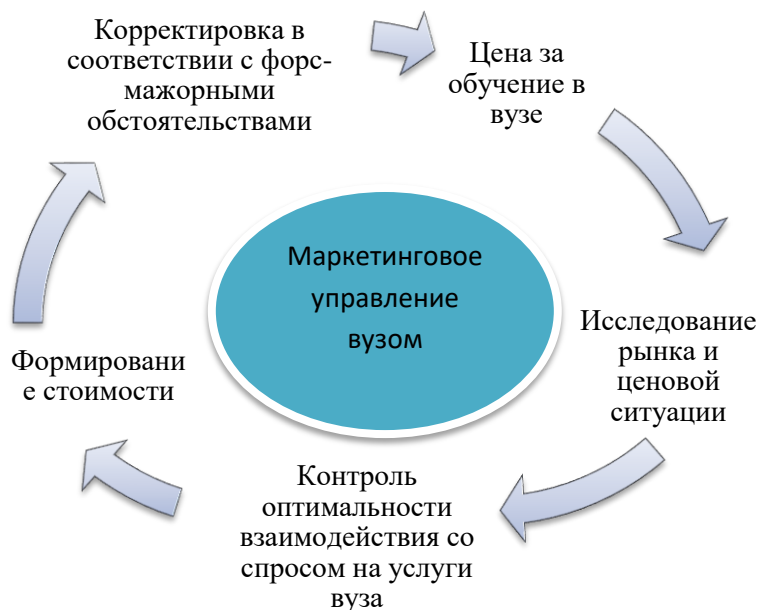
Рисунок 1. Место цены на рынке образовательных услуг

Примечание: Рисунок составлен авторами на основе (Бабан, 2010, 1 б.)